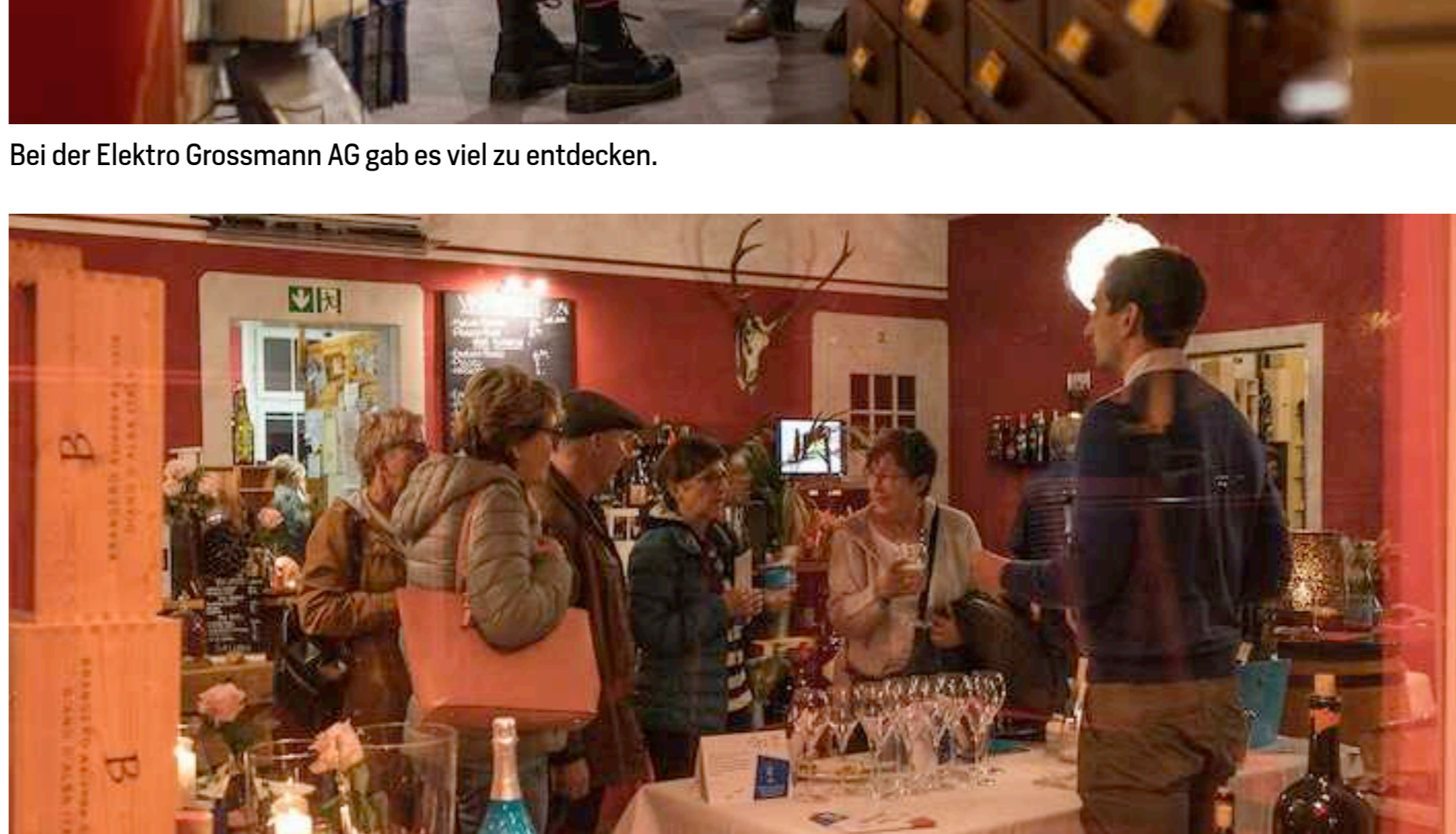
In der Enoteca Italia GmbH wurde die Vielfalt der italienischen Weine präsentiert.