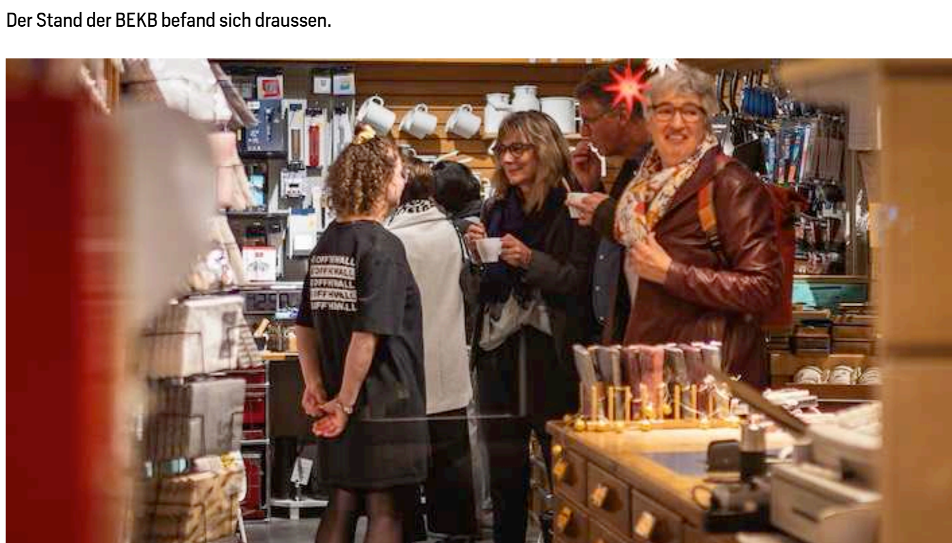
Bei der Elektro Grossmann AG gab es viel zu entdecken.