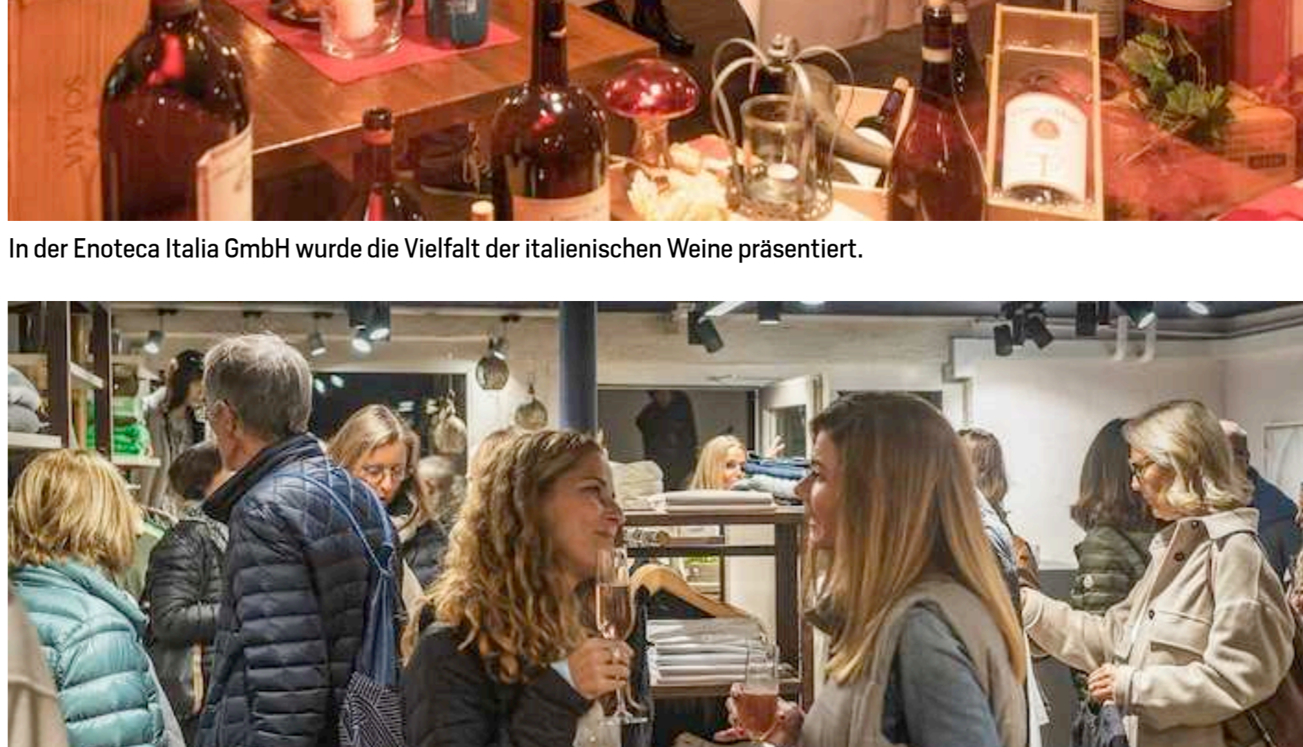
Bei der Passion Wear GmbH konnte angestossen werden.