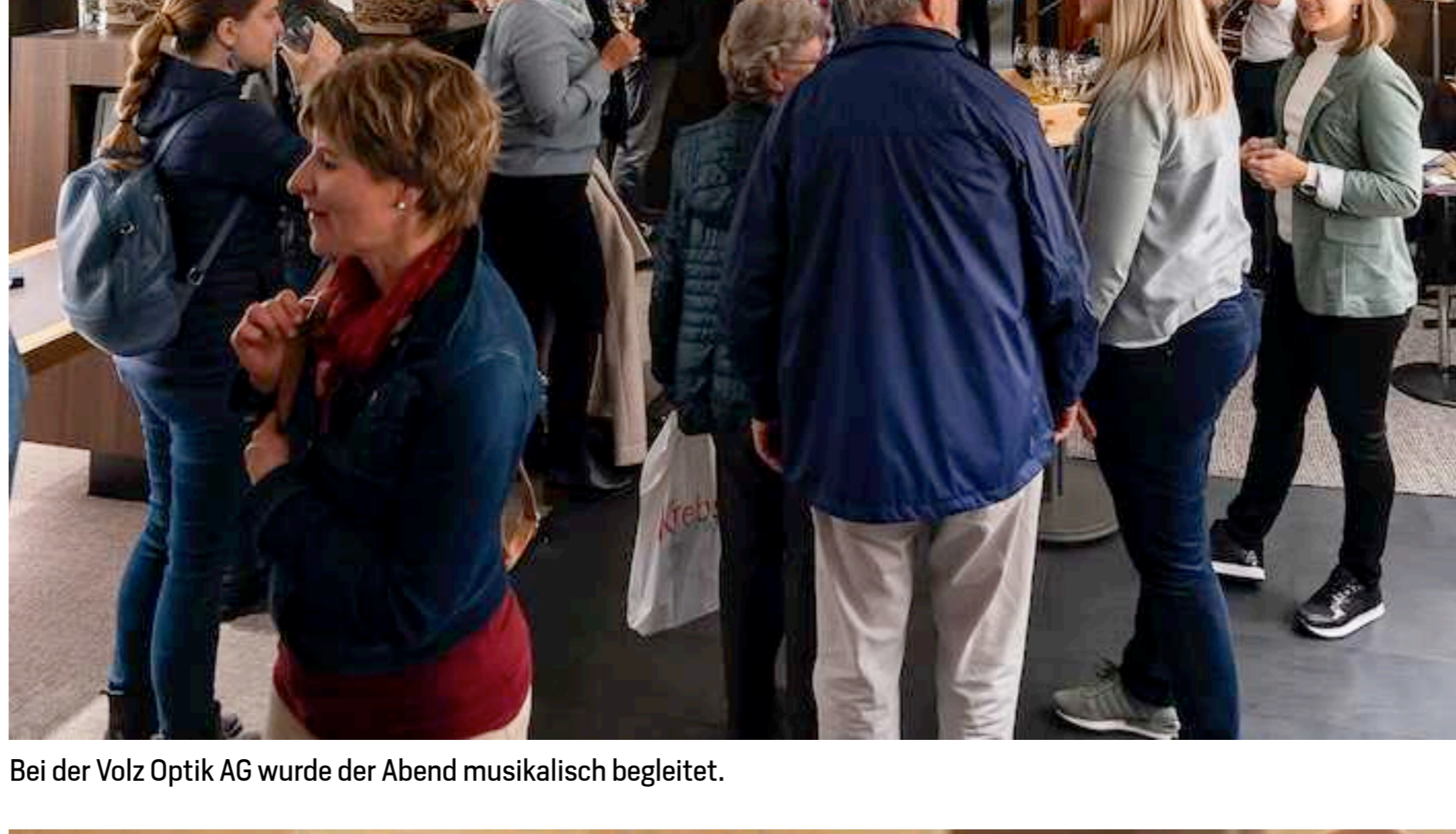
Beim Delikatessengeschäft vom Fass gabs einiges zum Probieren.