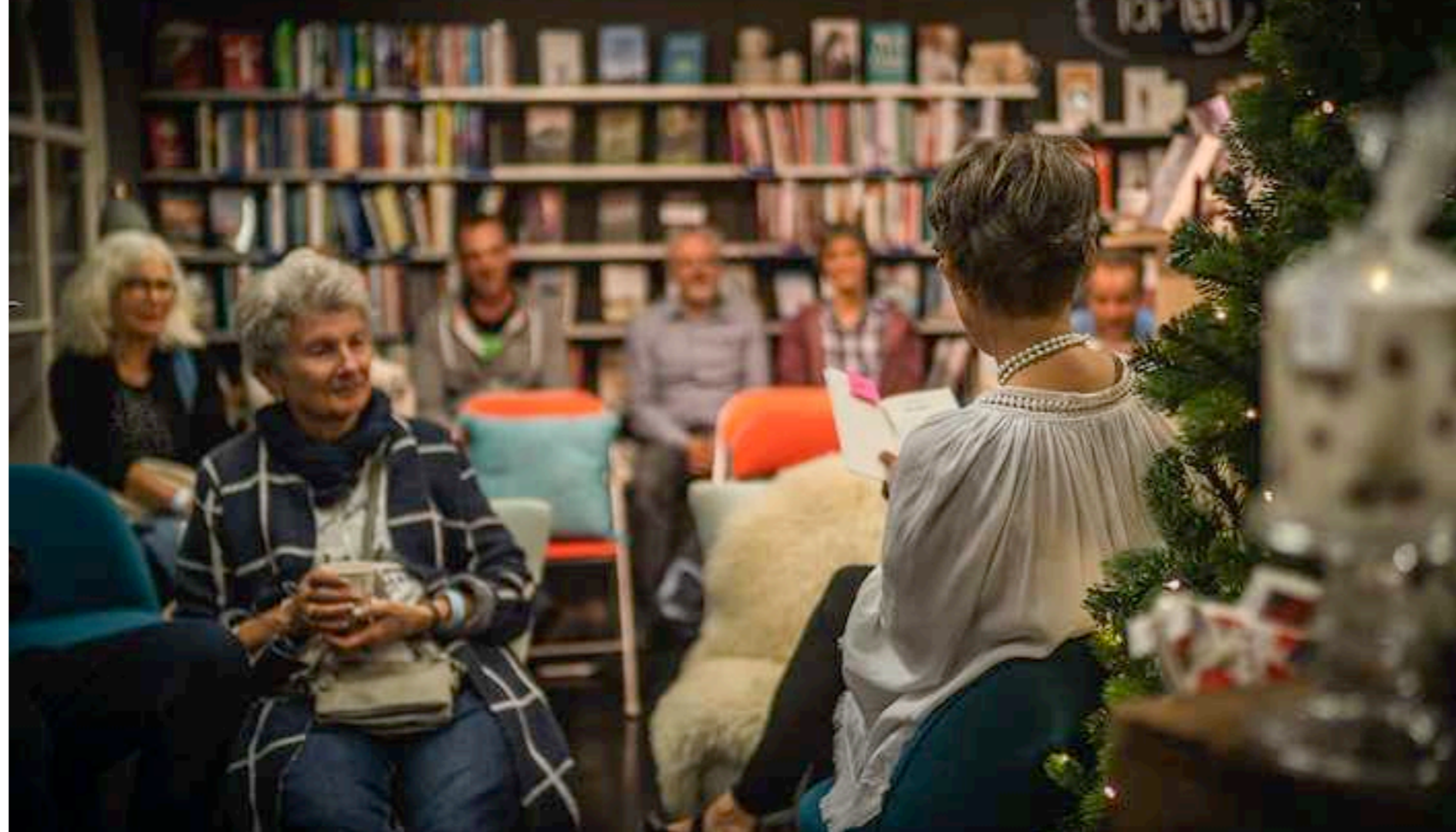
Im Buchladen Fontis wurde den Besuchern sogar vorgelesen.

Die geladenen Kundinnen und Kunden erhielten eine exklusive Einladung inklusive Badge, der ihnen Zutritt zu «ihrem» Geschäft gewährte. «Alle geladenen Gäste können sich aber auch in den übrigen teilnehmenden Geschäften umsehen», so Flück. Jedes Unternehmen biete an diesem speziellen Abend von «Thun genesst» einzigartige Genussmomente an: Konzerte, Präsentationen, Modenschauen, Kleinkunst und vieles mehr.