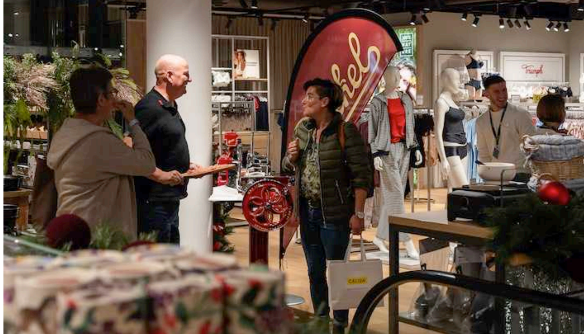
Im Loeb erhielten die Kunden etwas zu knabbern.