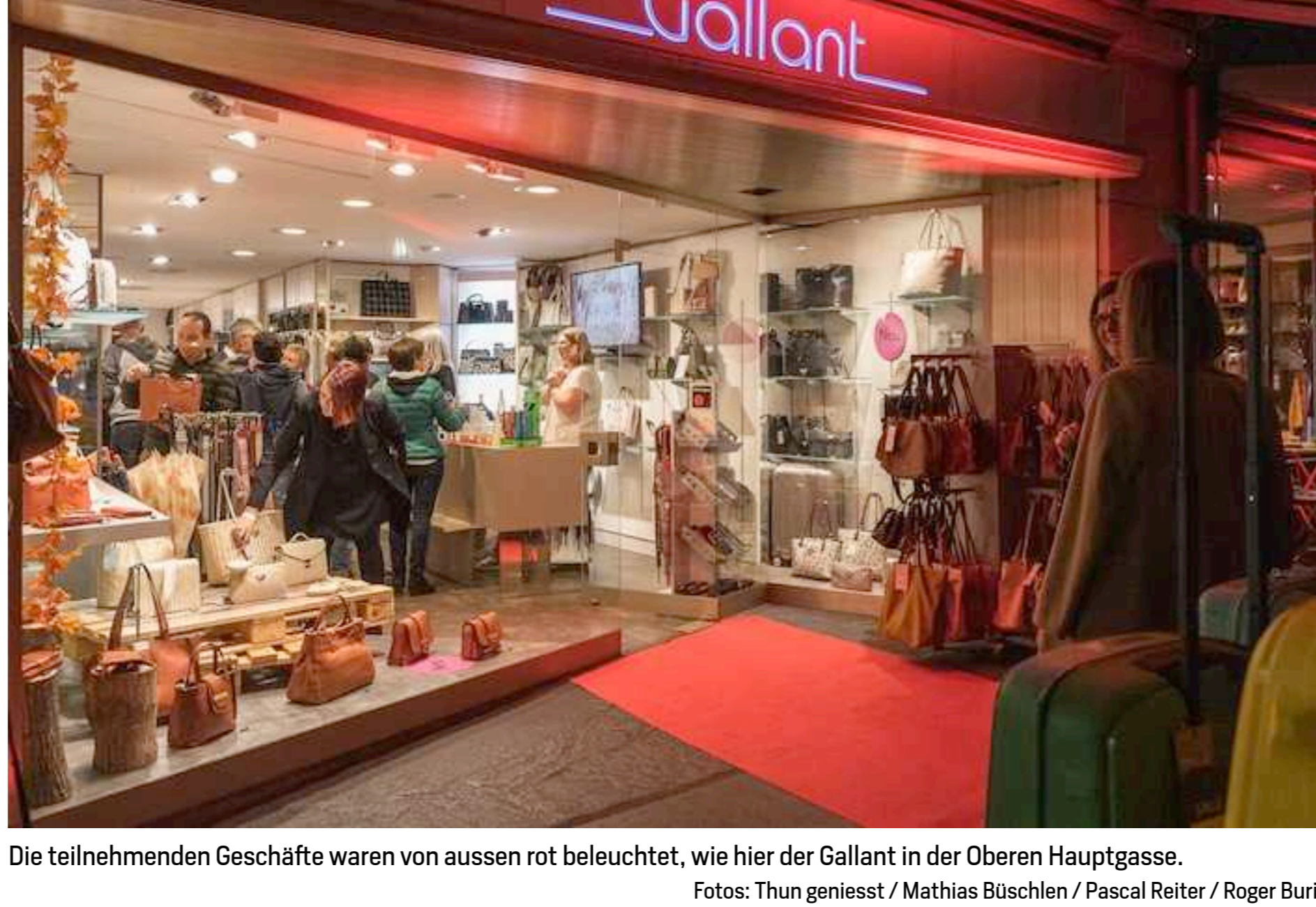
Die teilnehmenden Geschäfte waren von aussen rot beleuchtet, wie hier der Gallant in der Oberen Hauptgasse.